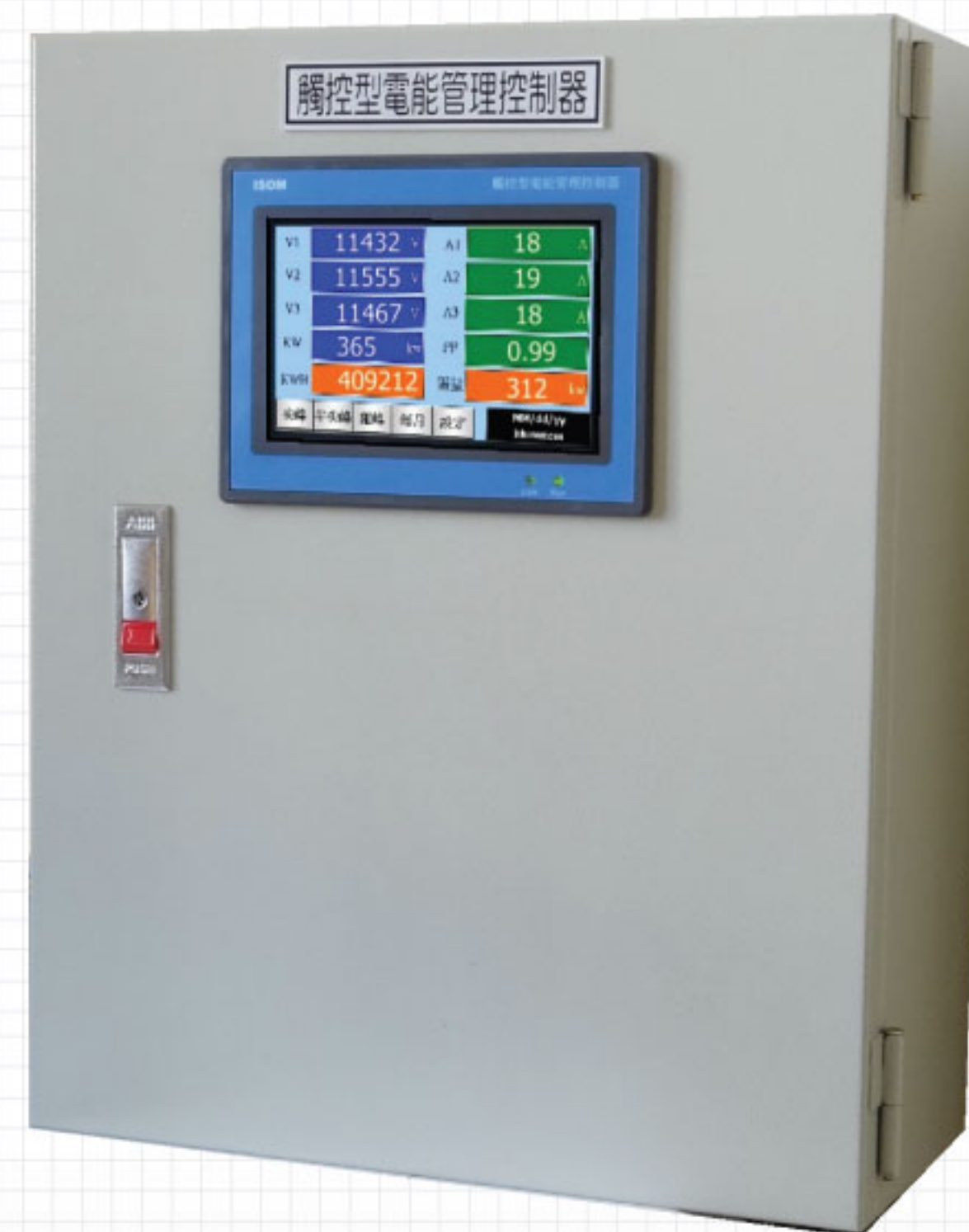
觸控型電能管理控制器 DMC系列